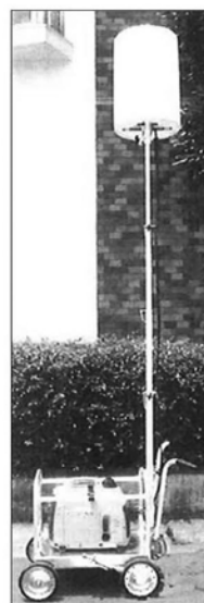
ぼんぼり君 400W 照明部高さ約 2,500 mm 台車寸法 L:770 × W:950 mm

●三脚タイプを屋外で使用する場合、転倒防止の為3~4本のロープで固定して下さい。